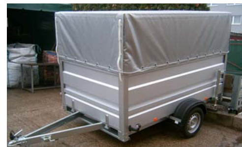
KLASIČNA PRIKOLICA Z POVIŠANIMI STRANICAMI IN CERADO