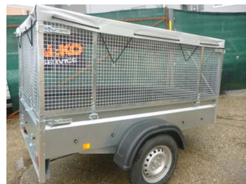
KLASIČNA PRIKOLICA Z MREŽO IN POKRIVALOM. NAMESTO POKRIVALA MOŽNA TUDI CERADA.